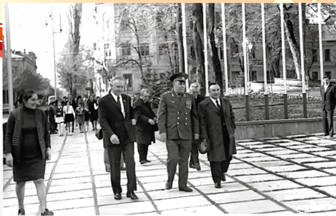
Открытие Дворца пионеров в 1974 г. в г. Орджоникидзе

• 26 сентября 1974 г. в честь 50-летия автономии Северной Осетии в г. Орджоникидзе состоялась юбилейная выставка